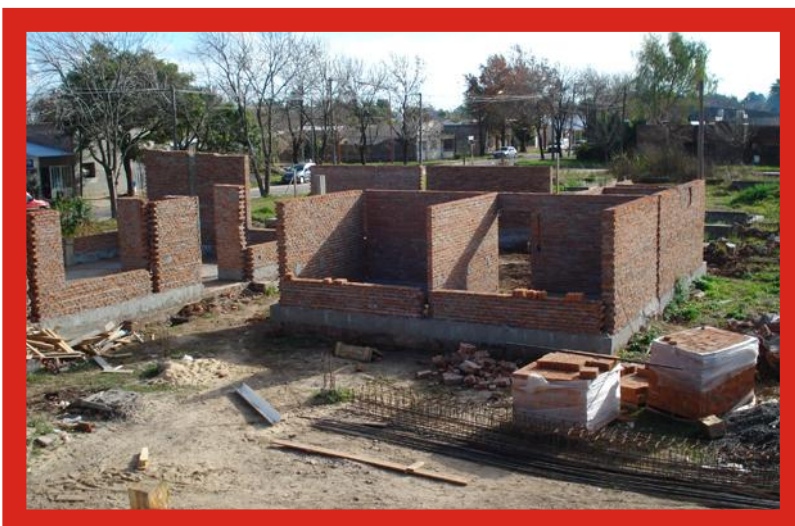
ESCUELA DE ENSEÑANZA MEDIA N° 371 Esperanza.