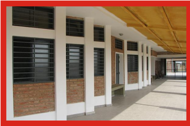
ESCUELA DE ENSEÑANZA MEDIA N° 537 Coronda.

Construcción 2 aulas y galería anexa pabellón sanitario.