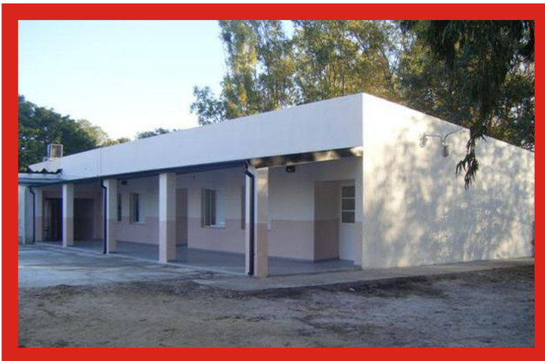
ESCUELA DE ENSEÑANZA MEDIA N° 311 La Criolla.